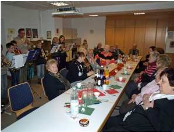
Musikjugend und Senioren im Pfarrheim Dezember 2009

Sinn dieser Maßnahme ist es, die Kirchengemeinde finanziell zu entlasten. Der Förderverein trägt ab diesem Jahr die Kosten für dieses Gebäude, wie zum Beispiel Strom, Wasser, Kanal, Reinigung, Schönheitsreparaturen usw.